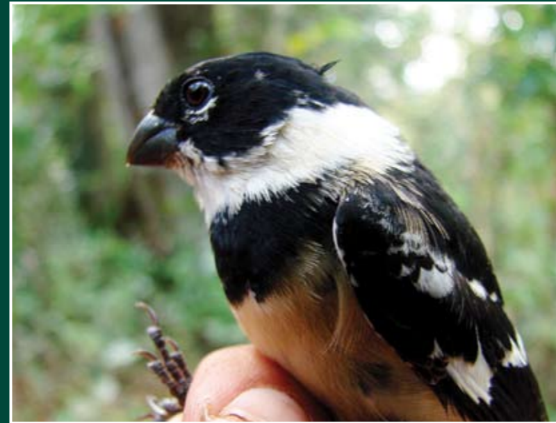
Sporophila torqueola ♂ Espiguero Collarejo