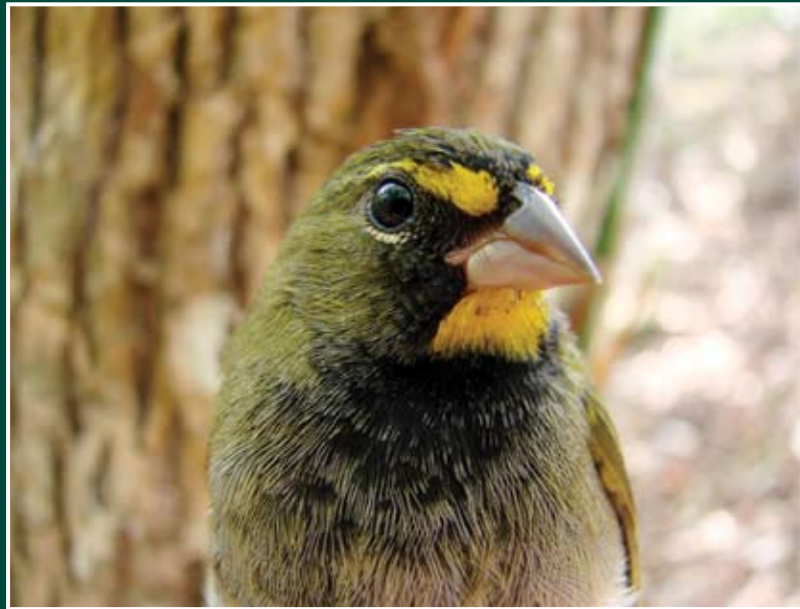
Tiaris olivacea ♂ Semillerito Cariamarrillo