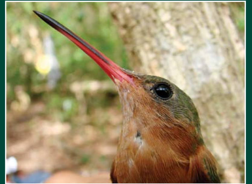
Amazilia rutila Amazilia canela