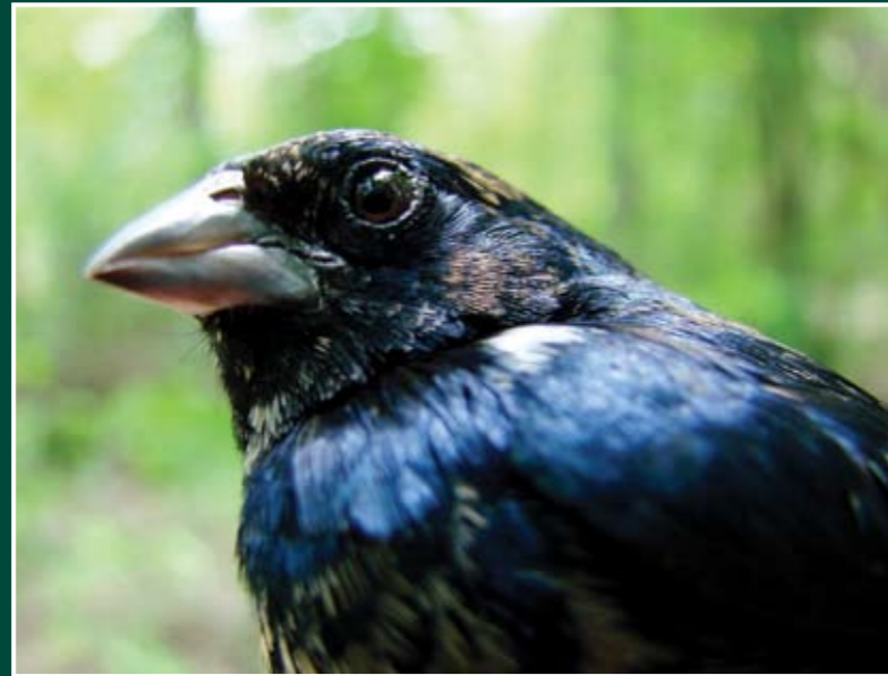
Volatinia jacarina ♂ Semillerito Negro