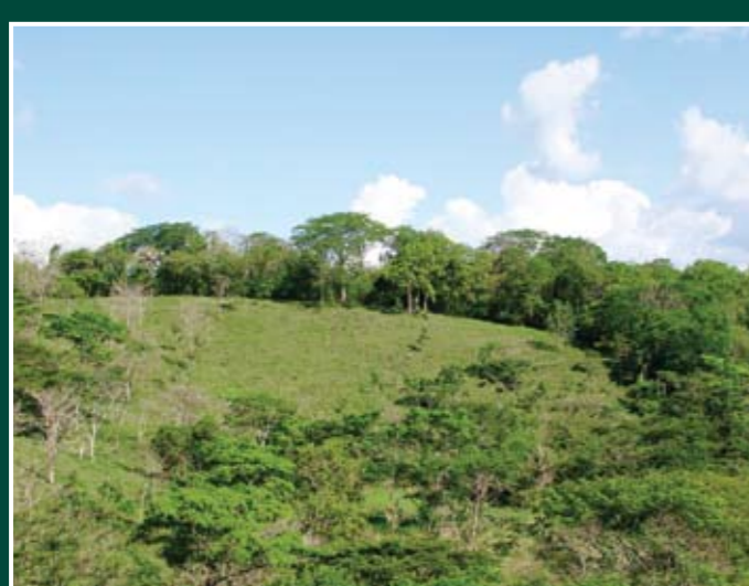
Parches de bosque